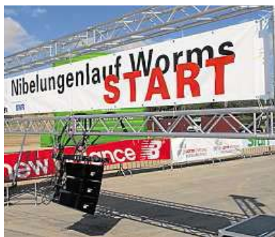
Mehr als 2000 Teilnehmer werden am Sonntag gespannt auf den Startschuss zum 7. Nibelungenlauf warten.

... und aktuelle News rund um den Nibelungenlauf unter www.nibelungenlauf.de , Tel. (06241) 42 55 00 oder Mail an info@nibelungenlauf.de .